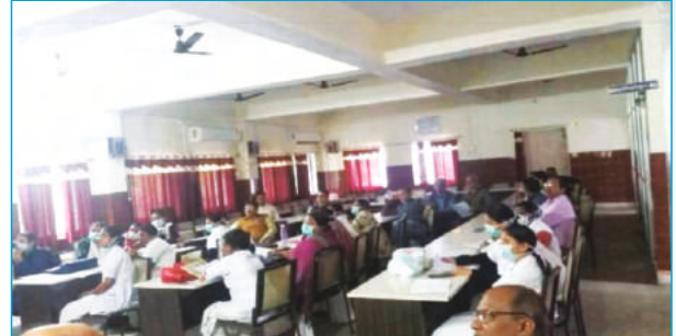
अनुग्रह नारायण मगध मेडिकल कॉलेज एवं अस्पताल, गया में अस्पताल अग्नि सुरक्षा पर क्षमतावर्धन

इस उच्चस्तरीय बैठक में लिए गये निर्णय के आधार पर 18 फरवरी, 2020 को अनुग्रह नारायण मगध मेडिकल कॉलेज एवं अस्पताल, गया। 19 फरवरी, 2020 को भागलपुर मेडिकल कॉलेज, भागलपुर में एक दिवसीय बैठक का आयोजन किया गया। बैठक में प्राधिकरण द्वारा अस्पताल अग्नि सुरक्षा से जुड़े हितभागियों का क्षमतावर्धन किया गया। अग्नि सुरक्षा के प्रति जागरूकता के उद्देश्य से अस्पताल के कर्मियों व संबंधित अधिकारियों, सुरक्षा कर्मियों आदि ने बैठक में भाग लिए।