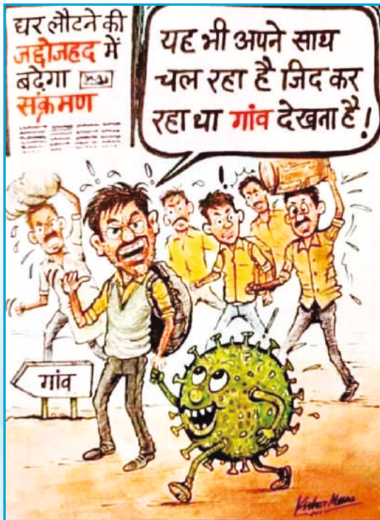
सोशल मिडिया से