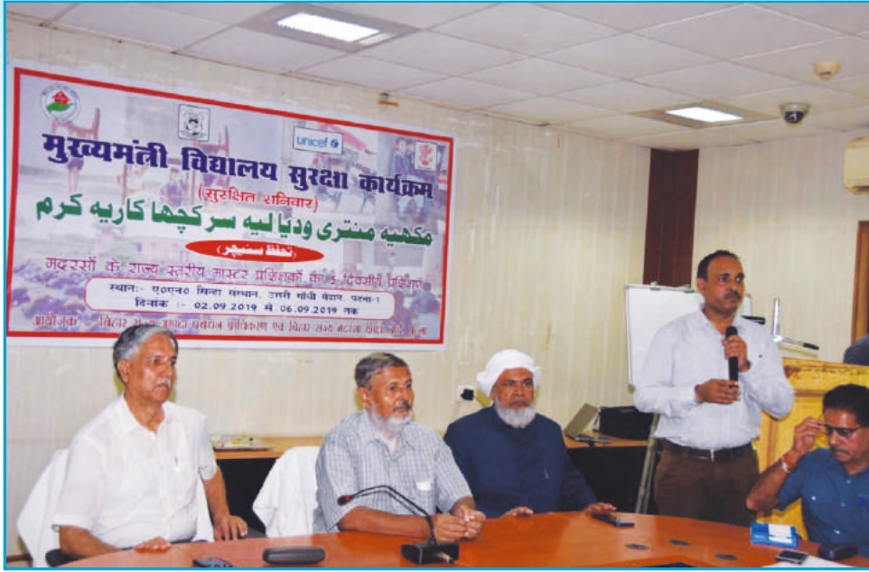
नौनिहालों की सुरक्षा के लिए सुरक्षित शनिवार