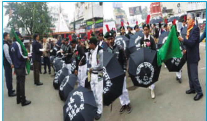
सड़क सुरक्षा के लिए अम्ब्रेला वाक